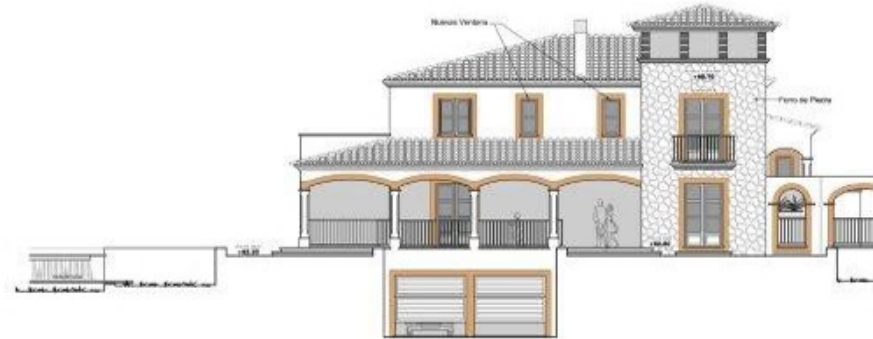
FACHADA LATERAL IZQUIERDA Esc. 1:100