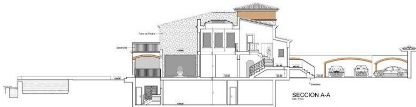
SECCION A-A Esc. 1:100