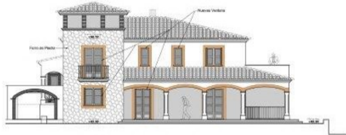
FACHADA LATERAL DERECHA Esc. 1:100