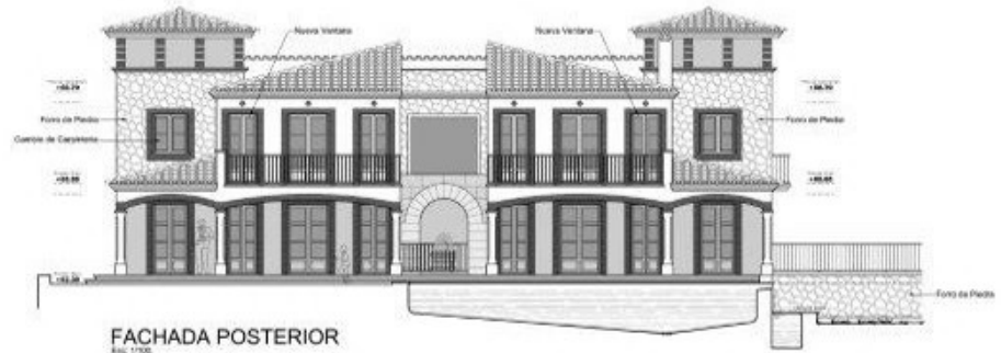
FACHADA POSTERIOR Esc. 1:100